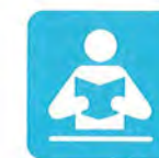
テキスト学習開始

基礎資格のある方が幼稚園教諭免許状・保育士資格を取得するため、必要な科目を履修することを目的としています。主に教科書や学習の手引きの教材を利用した在宅学習をベースに、中間試験・科目修得試験を受験、合格することで単位修得となります。自分のペースで学ぶことができるため、さまざまなライフスタイルに応じた学習が可能です。