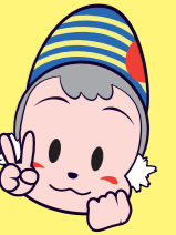
延岡市のご当地キャラクターのぼろくん